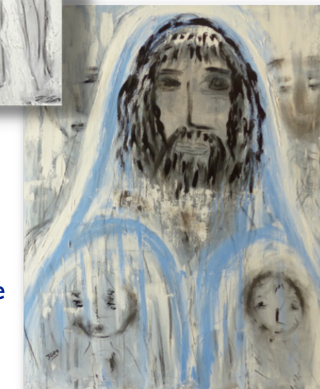
Sans Titre, 2015 92 x 73 cm Huile et fusain sur toile