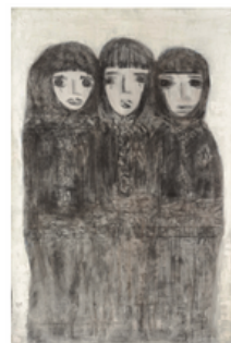
Sans titre, 8 cm 2007 194x128 cm Technique : Huile et fusain sur toile