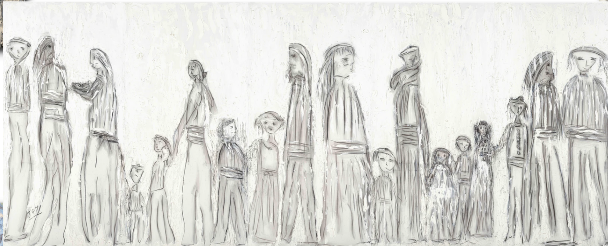
Sans Titre, 2022 Huile et fusain sur toile 195 x 480 cm (5 panneaux)