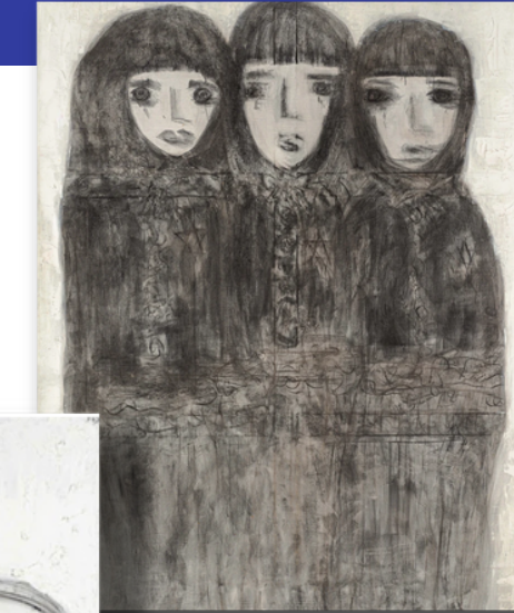
Sans Titre, 2007 194 x 128 cm Huile et fusain sur toile