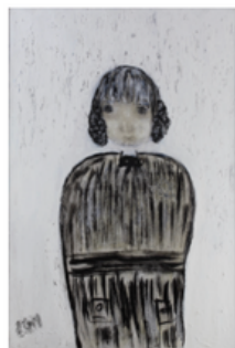
Sans titre 2000 149x109 cm Technique : Huile sur toile