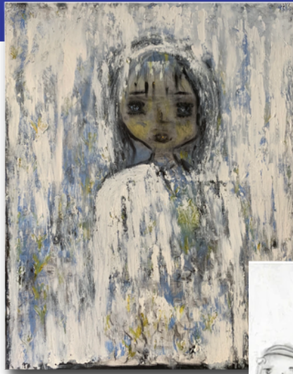
Sans Titre, 2015 92 x 73 cm Huile sur toile