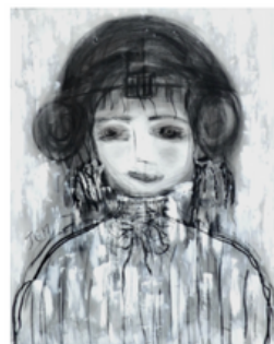
Sans titre 2014 146x114 cm Technique : Huile et fusain sur toile