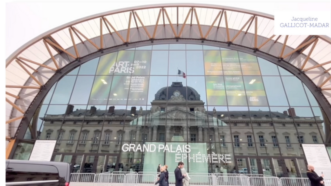
Vernissage et exposition - Grand Palais (Février 2022)

Lien du film au Centre Européen du Judaïsme